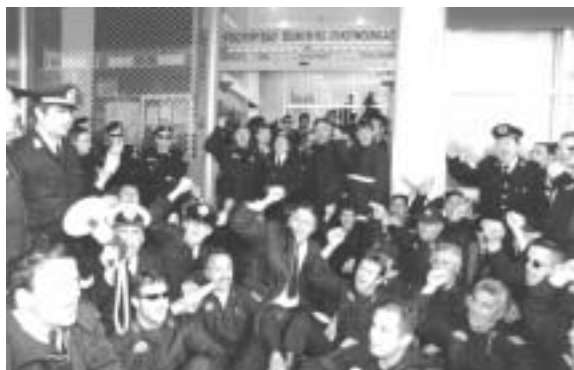
Άλλη μια δυναμική κοινή συγκέντρωση διαμαρτυρίας έξω από το υπουργείο Οικονομίας