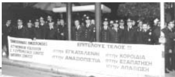
Άφιξη του πρωθυπουργού Κώστα Σημίτη στο Κοινοβούλιο εν μέσω διαδηλωτών των Σωμάτων Ασφαλείας, το Δεκέμβριο του 2001. Οι συγκεντρωμένοι παρέμειναν ως αργά τη νύχτα, εκφράζοντας την αγανάκτησή τους.