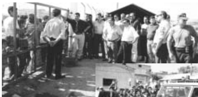
Ιούλιος 2002. Αντοφία στους καταναλισμούς προσφύγων και τα αστυνομικά κρατητήρια των υπηρεσιών του Έβρου, όπου δοκιμαζόταν η ανθρώπινη αξιοπρέπεια.