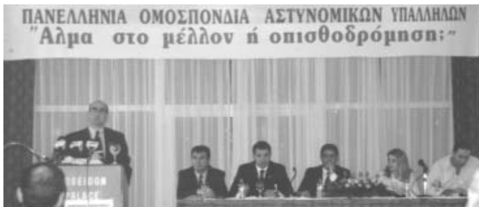
Ο υπουργός Δημόσιας Τάξης Γιώργος Βουλγαράκης στο βήμα του 16ου πανελλαδικού συνεδρίου της ΠΟΑΣΥ το 2005