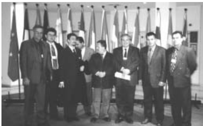
Παράσταση διαμαρτυρίας στο Ευρωκοινοβούλιο για τη μη τήρηση των κανόνων υγιεινής και ασφάλειας