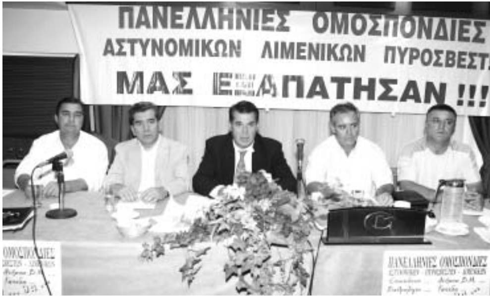
Στιγμιότυπο από τη συνέντευξη τύπου των εκπροσώπων των Ομοσπονδιών των Σομάτων Ασφαλείας στη Θεσσαλονίκη, το Σεπτέμβριο του 2005