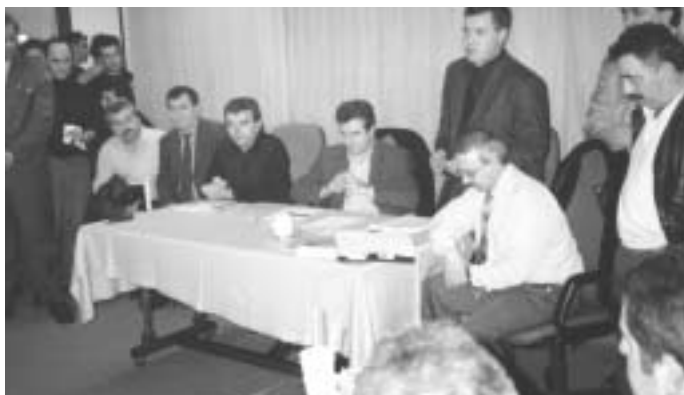
Ο υπουργός Δημόσιας Τάξης Μιχάλης Χρυσοχοϊδής με την ανάληψη των νέων του καθηκόντων ενημερώνεται για τα εκκρεμείζητήματα κατά τη διάορκεια Γενικού Συμβουλίου