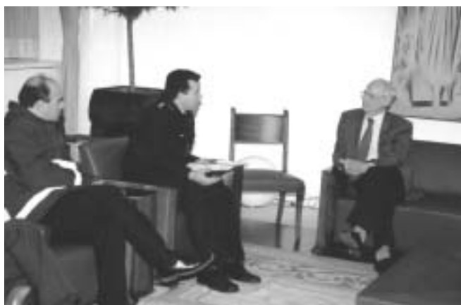
Με τον πρόεδρο της Βουλής Απόστολο Κακλαμάνη στο πλαίσιο κινητοποίησης, στις 9 Δεκεμβρίου 2003