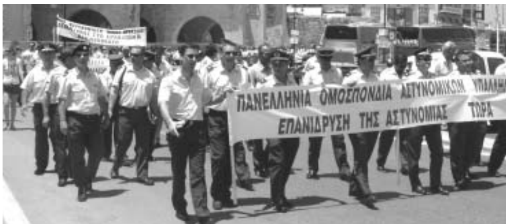
Στιγμιότυπο από την περιφερειακή συγκέντρωση διαμαρτυρίας στο Ηράκλειο Κρήτης, στις 14 Ιουνίου 2007