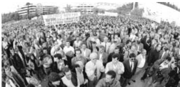
Στιγμιότυπο από τη συγκέντρωση των Ομοσπονδιών των αστυνομικών και των πυροσβεστών το 1995 στο Παναθηναϊκό Στάδιο