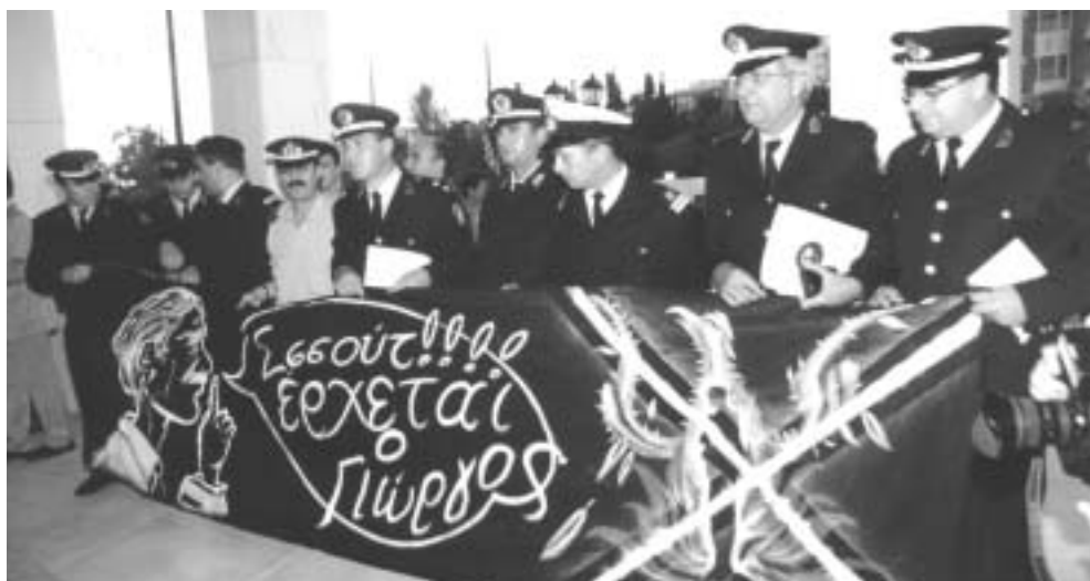
Η συμβολική απάντηση των προεδρείων των ενστόλων για τα δακρυγόνα της 8ης Οκτωβρίου στο Σύνταγμα, έξω από το Χίλτον, κατά τη διάρκεια της επίσημης εκδήλωσης για την Ημέρα της Ελληνικής Αστυνομίας (20 Οκτωβρίου), από την οποία απείχαν σε ένδειξη διαμαρτυρίας