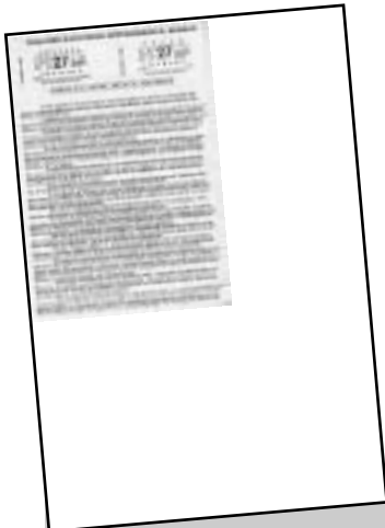
Η προκήρυξη του Σωματίου της Δράμας στις 27 Ιουνίου 1989 με αφορμή την πρώτη επέτειο της ίδρυσής του