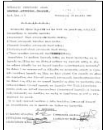
Το ιστορικό πρακτικό της συνάντησης της 22ας Απριλίου 1989 στη Θεσσαλονίκη, εκπροσώπων εννιά σωματείων για την ίδρυση της Ομοσπονδίας