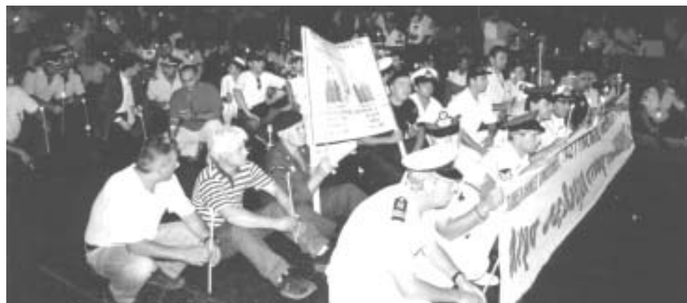
24 Ιουλίου 2003, ανήμερα της επετείου για την αποκατάσταση της Δημοκρατίας, εκατοντάδες ένστολοι διαδηλώνουν έξω από το Κοινοβούλιο και ανάβουν κεριά στη μνήμη των νεκρών συναδέλφων τους