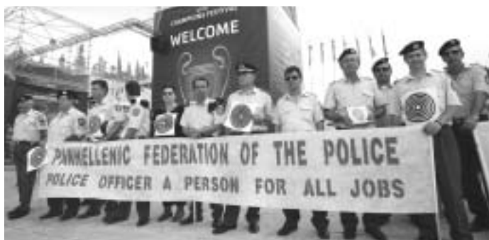
Στιγμιότυπο από τη δυναμική κινητοποίηση με αφορμή τον τελικό αγώνα ποδοσφαίρου του Champions League, το Μάιο του 2007 στην Αθήνα