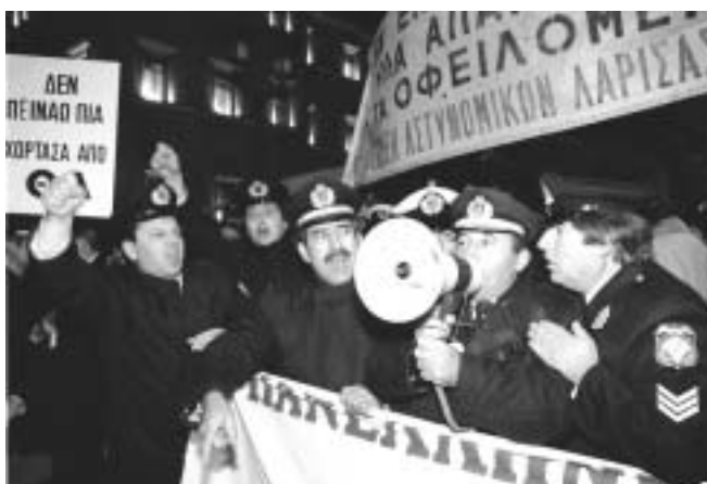
Στιγμιότυπο από τις πρώτες κινητοποιήσεις των σωματείων της Θεσσαλίας