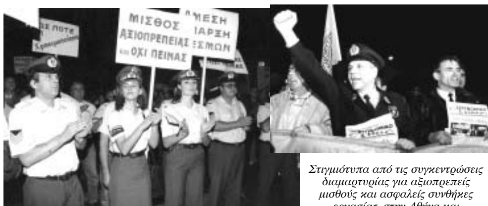
Στιγμιότυπα από τις συγκεντρώσεις διαμαρτυρίας για αξιοπρεπείς μισθούς και ασφαλείς συνθήκες εργασίας, στην Αθήνα και την επαρχία το 1997