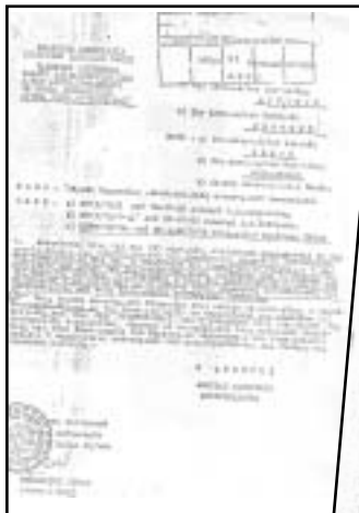
Διαταγές του Αρχηγού της Αστυνομίας Ανδρέα Καλογερά για την παρακολούθηση και την καταγραφή της συνδικαλιστικής δράσης των πρωτοπόρων αστυνομικών