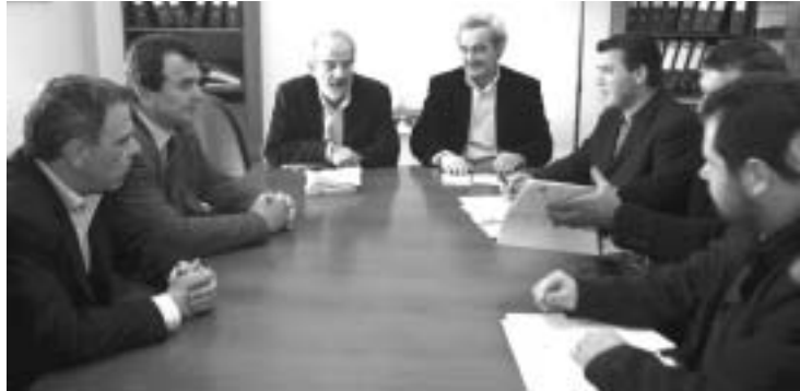
Από τη συνάντηση με τον πρόεδρο του Συνασπισμού της Αριστεράς Αλέκο Αλαβάνο, το Μάρτιο του 2007