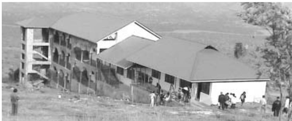
Το σχολικό συγκρότημα που οικοδομήθηκε στη Τανζανία με εισφορές των αστυνομικών μελών της ΠΟΑΣΥ