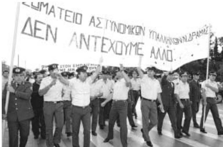
Αθήνα, 12 Οκτωβρίου 1995. Αστυνομικοί απ' όλη την Ελλάδα διαδηλώνουν για την εισοδηματική πολιτική της κυβέρνησης