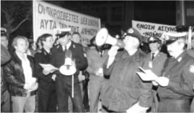
Αθήνα 12 Φεβρουαρίου 1998: Σε αναβρασμό ολόκληρο το συνδικαλιστικό κίνημα