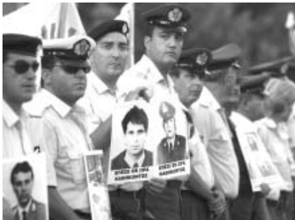
Οι αστυνομικοί διαδηλώνουν, διεκδικώντας από την πολιτεία τη θεσμοθέτηση του επαγγέλματός τους ως επικίνδυνου και ανθυγιεινού