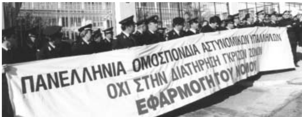
Την 1η Φεβρουαρίου 2002, έξω από τις φυλακές Κορυδαλλού για τη συνεχιζόμενη μη αποδέσμευση της Αστυνομίας από τη φύλαξη των σωφρονιστικών καταστημάτων