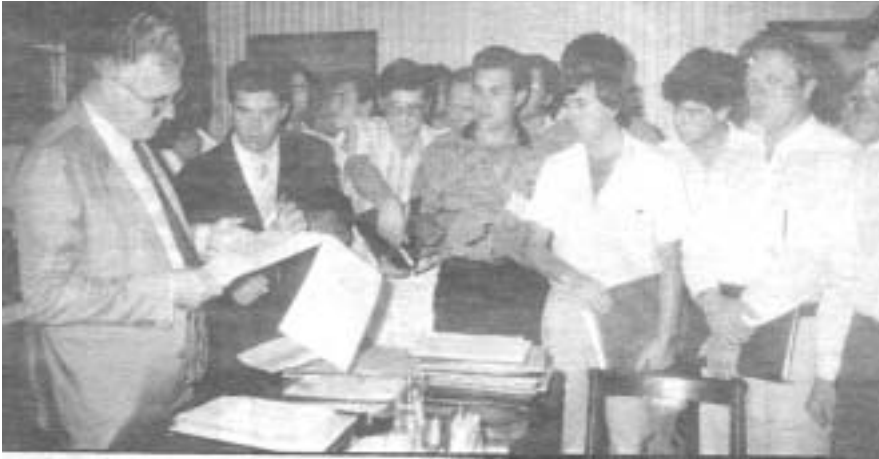
Η ιστορική συνάντηση, στις 31 Αυγούστου 1989, με τον υπουργό Δημόσιας Τάξης Γιάννη Κεφαλογιάννη