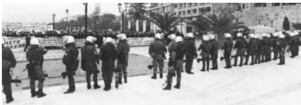
Ναύπλιο, 24 Ιανουαρίου 2003. Η Ομοσπονδία δίνει δυναμικό παρόν στη Σύνοδος υπουργών Εργασίας της Ευρωπαϊκής Ένωσης, σε ένδειξη διαμαρτυρίας για τη μη θεσμοθέτηση της επικινδυνότητας της εργασίας.