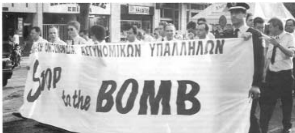
Αντιπολεμική πορεία της ΠΟΑΣΥ για τον πόλεμο στη Γιουγκοσλαβία το 1999