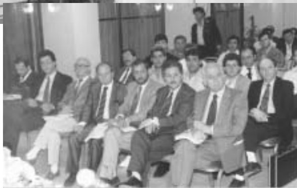
Στιγμιότυπα από το 3ο συνέδριο της ΠΟΑΣΥ, το Μάιο του 1992. Τις εργασίες του τιμούν με την παρουσία τους, ο πρώην υπουργός Δημόσιας Τάξης Γιάννης Σκουλαρίκης, ο πρώην υπουργός Φώτης Κουβέλης, ο βουλευτής της Νέας Δημοκρατίας Θεόδωρος Κασίμης, ο πρόεδρος της Ένωσης Δικαστών και Εισαγγελέων Παναγιώτης Κωστάκος, ο εκπρόσωπος του ΚΚΕ Χρήστος Λογαράς και ο εκπρόσωπος του Συνασπισμού Παναγιώτης Σταθόπουλος.