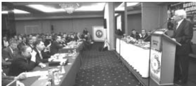
Ο υπουργός Εσωτερικών Προκόπης Παυλόπουλος απευθύνει χαιρετισμό στο 18ο συνέδριο της ΠΟΑΣΥ, το Δεκέμβριο του 2007