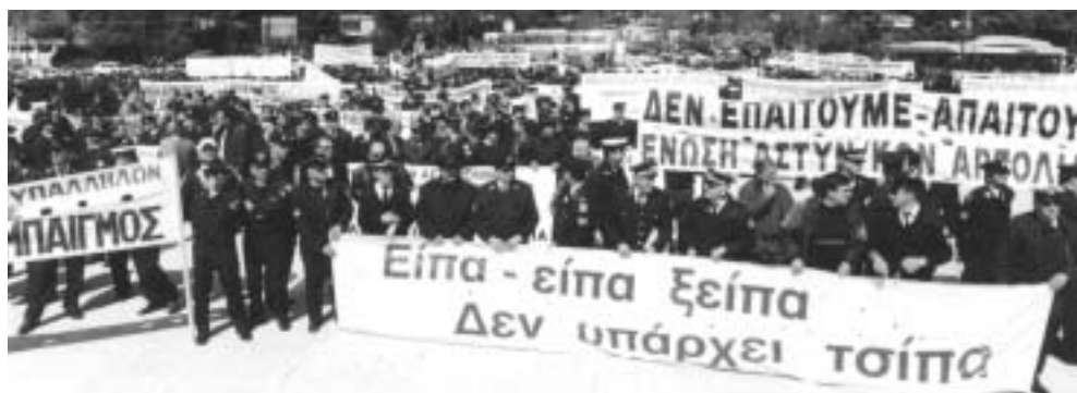
Παναθηναϊκό Στάδιο, 2 Απριλίου 2002. Δυναμική προσέλευση των ενστόλων από κάθε γωνιά της χώρας.