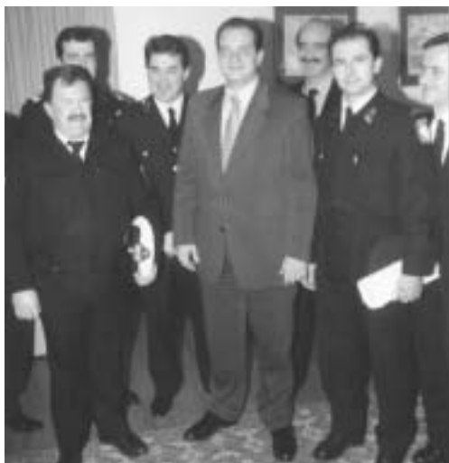
Με τον πρόεδρο της Νέας Δημοκρατίας Κώστα Καραμανλή και την γραμματέα του ΚΚΕ Αλέκα Παπαρήγα, αντιπροσωπείες των Ομοσπονδιών των αστυνομικών, των πυροσβεστών και των λιμενικών