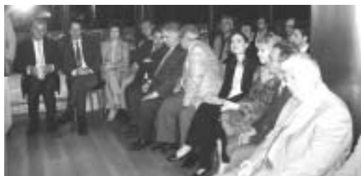
Στιγμιότυπο από την εκδήλωση της ΠΟΑΣΥ προς τιμήν των πολιτικών που κατάγονται από αστυνομικές οικογένειες, στις 15 Ιουνίου 2006