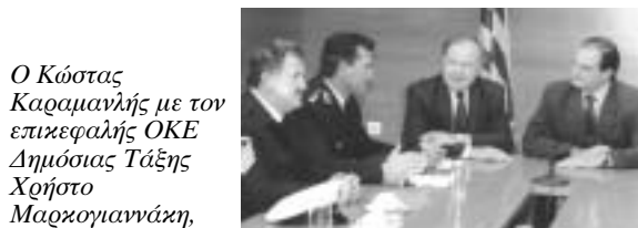
Ο Κώστας Καραμανλής με τον επικεφαλής ΟΚΕ Δημόσιας Τάξης Χρήστο Μαρχογιαννάκη, ενημερώνονται από τον πρόεδρο της ΠΟΑΣΥ Δημήτρη Κυριαζίδη και τον πρόεδρο της ΠΟΕΠΑΣ Γιώργο Παναγόπουλο