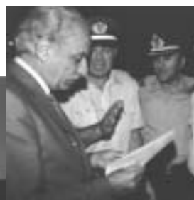
Άλλη μια συγκέντρωση διαμαρτυρίας στη συμπρωτεύουσα, στις 5 Σεπτεμβρίου 2003, κοινή με τις Ομοσπονδίες των πρorosβεστών και των λιμενικών, για τα κοινά προβλήματα. Ο κυβερνητικός εκπρόσωπος Τηλέμαχος Χυτήρης παραλαμβάνει το ψήφισμα διαμαρτυρίας.