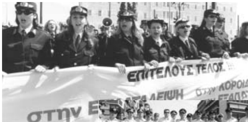
Το 2002, η ΠΟΑΣΥ συμμετέχει στα πανελλαδικά συλλαλητήρια της ΓΣΕΕ και της ΑΔΕΔΥ για το ασφαλιστικό