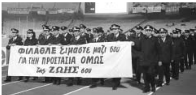
Η ΠΟΑΣΥ διαμαρτυρείται για τη βία στα γήπεδα, μέσα στο ΟΑΚΑ, τον Δεκέμβριο 1997