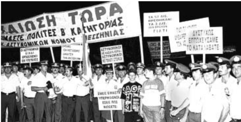
Αθήνα, 9 Ιουλίου 1996: «Δυστυχώς επτωχέσαμε, το καταλάβατε;» γράφει ένα πανό για να δείξει το μέγεθος του προβλήματος