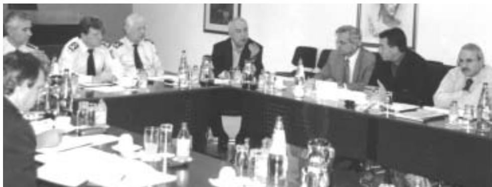
Η νέα ηγεσία της Αστυνομίας (2004) ενημερώνεται από την Εκτελεστική Γραμματεία για τα αιτήματα της Ομοσπονδίας