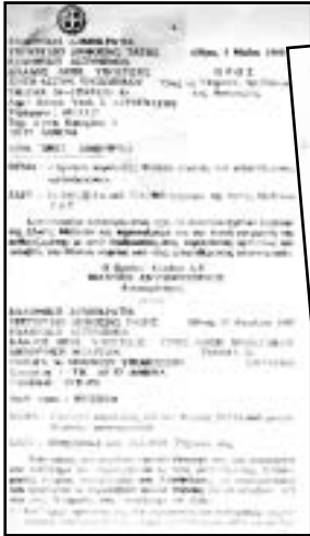
Η διαταγή του υφυπουργού Σήφη Βαλνυράκη για τη σύλληψη και την ποινική δίωξη των συνδικαλιστών που αρνούνται να πάρουν φύλλο πορείας.