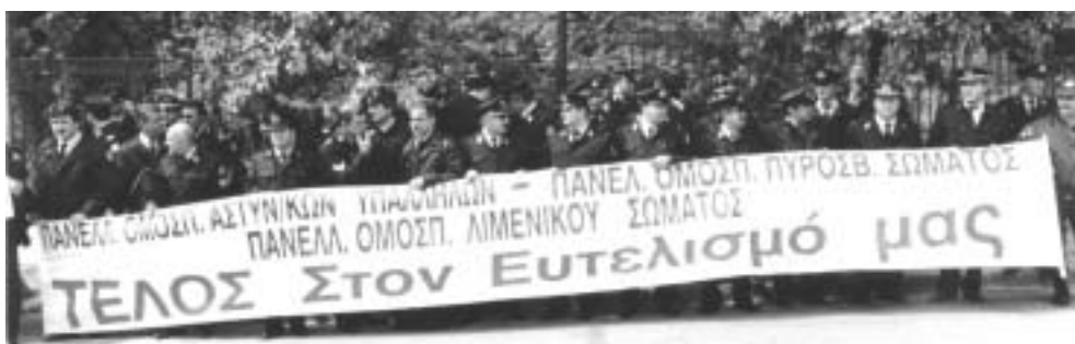
Στις 12 Μαρτίου 2001, έξω από το Μέγαρο Μαξίμου, οι ένστολοι ξεδιπλώνουν πανό διαμαρτυρίας για τις ανεκπλήρωτες δεσμεύσεις των αρμοδίων υπουργών