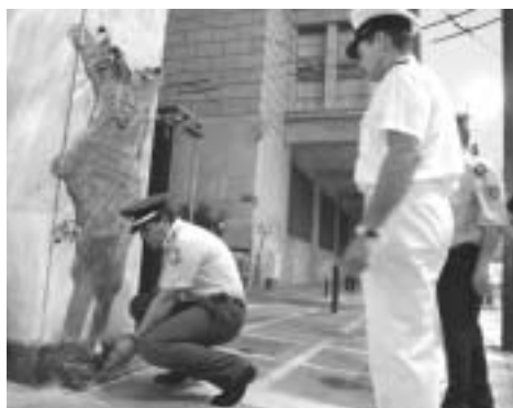
24 Ιουλίου 2005. Λίγα λουλούδια, στο πλαίσιο της κοινής εκδήλωσης διαμαρτυρίας των αστυνομικών, των λιμενικών και των πυροσβεστών, από τον Δημήτρη Κυριαζίδη, στο σημείο που έχασε τη ζωή του ο φοιτητής Σωτήρης Πέτρονλας - σύμβολο των δημοκρατικών αγώνων του λαού μας- την ανώμαλη πολιτική περίοδο της δεκαετίας του 60